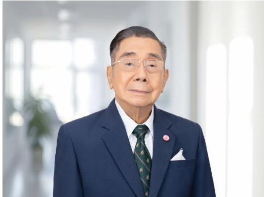
นายกองเอก เปล่งศักดิ์ ประกาศเกสัช